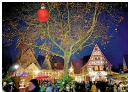
Impressionen vom Weihnachtsmärkte im Städtle vom letzten Jahr

Das Weihnachtsmärkte im Städtle ist ein wahrer Höhepunkt der Vorweihnachtszeit