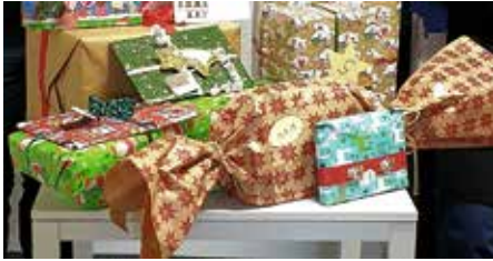
Geschenke aus der Wunschzettel-Aktion

Vor allem die Kinder und Jugendlichen leiden ganz besonders unter diesen vielen Krisen.