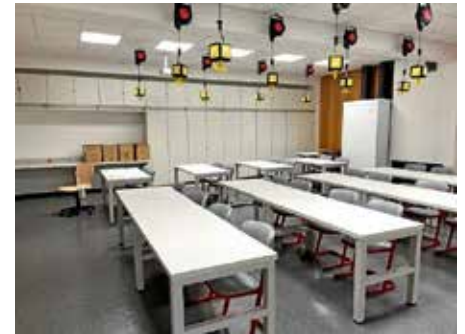
Umbau des NWT Bereichs am Hölderlin-Gymnasium

gen Schüler kommen aus Nordheim (240) und aus Neckarwestheim mit 137 Schülern.