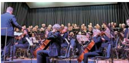
Ein deutsches Requiem (Johannes Brahms)