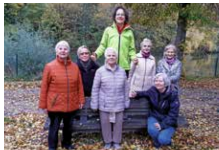
Bewegungstreff – bei jedem Wetter! ■

Das Angebot ist kostenlos und unverbindlich – eine Anmeldung ist nicht notwendig. Sportkleidung ist nicht erforderlich. Die Teilnahme erfolgt auf eigene Gefahr.