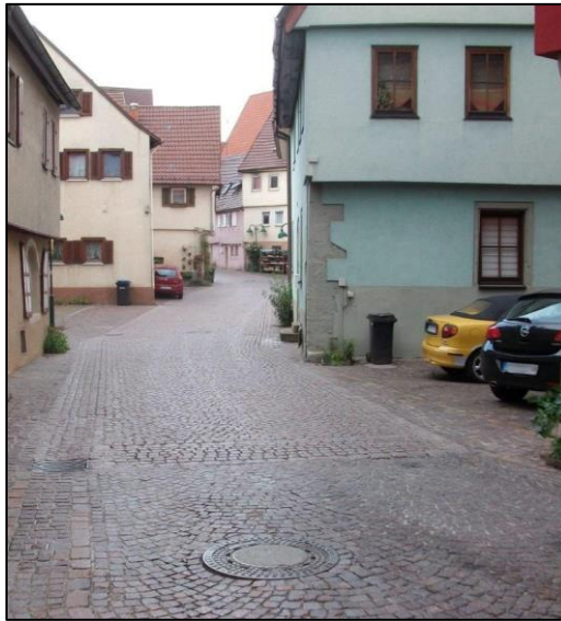
Abb. 02: Mühltorstraße Ecke Hausnummer 25