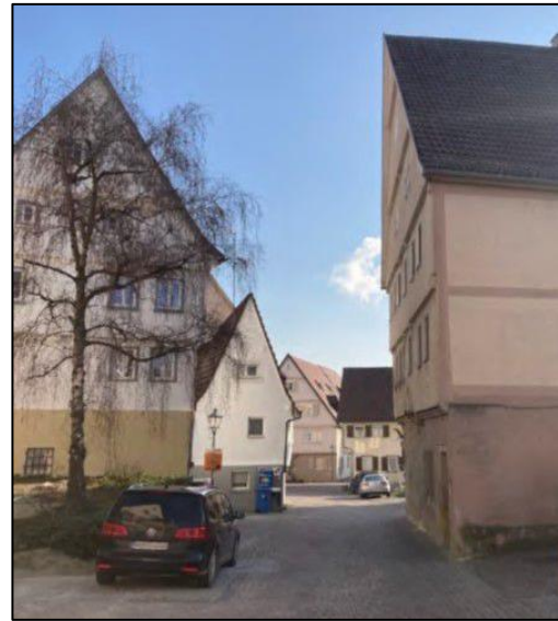
Abb. 03: öffentliche Kfz-Stellplätze Mühltorstraße

Der Bewertung der verkehrlichen Verträglichkeit wird die Verkehrsstärke in der maßgebenden Spitzenstunde zu Grunde gelegt.