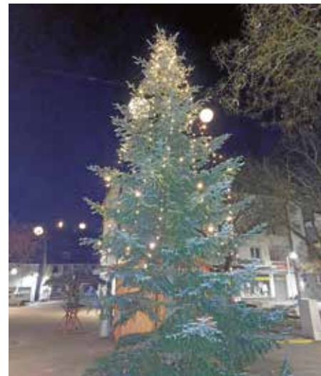
Familie Mayer aus dem Reisweg spendete den Baum, der auf dem Postplatz steht.

Die Weihnachtsbäume stehen in diesem Jahr auf dem Postplatz sowie in der Lange Straße und tragen wesentlich zur stimmungsvollen Adventsatmosphäre in der Innenstadt bei.