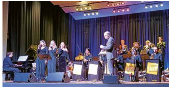
Das LaJazzO, hier alle drei Gesangssolistinnen, lieferte unter der Leitung von Klaus Graf eine fantastische Leistung ab, die vom Lauffener Publikum begeistert gefeiert wurde.

Nachdem der letzte Akkord des Stückes „Moanin“ von Charles Mingus verklungen war, brandeten tosender Applaus und Zugabe-Rufe in der vollen Stadthalle auf. Diese Begeisterungstürme dankte das LaJazzO mit einer mitreißenden Zugabe, einem absoluten Jazz-Klassiker: „Birdland“ des österreichischen Komponisten Joe Zawinul, eine Komposition wie geschaffen für eine Zugabe. In „Birdland“ wird das Lebensgefühl im legendären Birdland-Jazzclub, benannt nach dem Saxo-