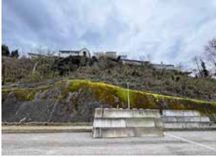
Hang am Radweg

Neckarwestheim, Brackenheim, Talheim und Hausen. Die Zahlen zeigen deutlich, dass die Schulen in Lauffen eine wichtige regionale Bildungsfunktion erfüllen.