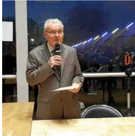
Am Sonntag waren in Frankreich Kommunalwahlen

natürlich der Verkehrssicherheit des stark frequentierten Neckartalradweges. Für die kurzfristig erforderlichen Sicherungsmaßnahmen sind im Haushaltsplan 2026 bisher keine Mittel im Investitionsprogramm veranschlagt. Die Finanzierung der 187.00 Euro muss daher außerplanmäßig bzw. über nicht benötigte Mittel veranschlagter Maßnahmen. Beantragt haben wir eine Landesförderung nach dem LGVFG in Höhe von 50 %. Der Neckartalradweg zwischen Lauffen und Heilbronn wurde im Jahr 2018 fertiggestellt.