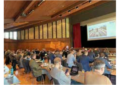
Zahlreiche Bürgermeister der Städte ab 10.000 Einwohner konnten wir in der Stadthalle begrüßen.