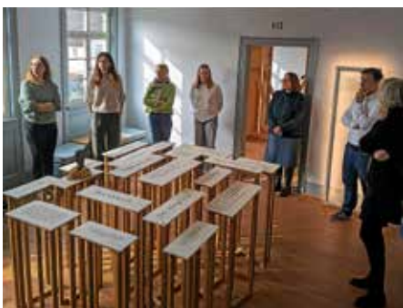
Der Tourismus-Stammtisch der TG Heilbronner Land traf sich Ende März 2026 im Hölderlinhaus.