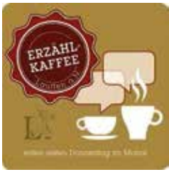
Logo Erzählkaffee Kieser-Hess