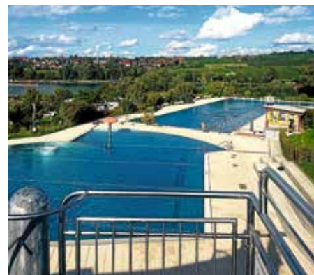
Freibad Ulrichsheide – So schön

Die Erschließungsanlagen waren zu diesem Zeitpunkt soweit fertig gestellt, dass eine Bebauung des Gebiets freigegeben werden konnte.