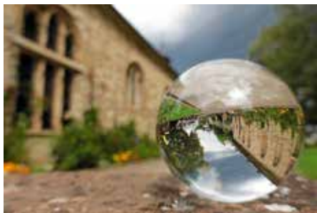
Hannah Lorenz: Lauffener Klosterhof in der Glaskugel – aus dem Wettbewerb zum Foto des Jahres 2021

Die Öffnungszeiten werden – unter Voraussetzung der personellen Kapazität – entsprechend Ziff. 2.2 der Vorlage beschlossen – auch der Schließtag bleibt bestehen und kann von den Vereinen genutzt werden.