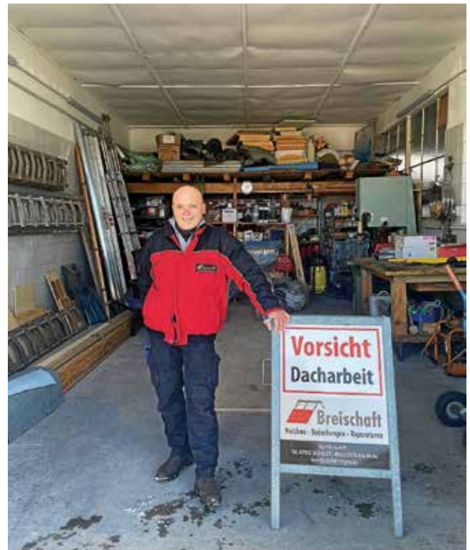
Holzbau Breischaft verlagert Betriebssitz