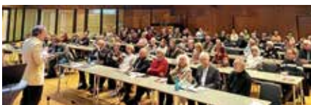
Gut besuchter Vortrag von VDK und Volkshochschule

Der Geburtstag Hölderlins wurde so nicht nur als Erinnerung an einen großen Dichter begangen, sondern auch als Anlass, seine Werke neu zu entdecken und lebendig zu halten.