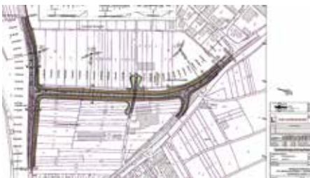
Querspange B 27 – Plan aus der Einwohnerversammlung