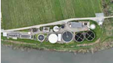
Luftbild der Lauffener Kläranlage