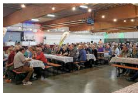
Geselliges Beisammensein steht beim städtischen Seniorennachmittag im Vordergrund.

dem Gesangverein Urbanus, den Lauffener Landfrauen, Metzgerei Jäger und Bäckerei