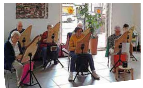
Veeh-Harfen Gruppe Lauffen/N.

„Nun will der Lenz uns grüßen“, „Im Märzen der Bauer“, „Wohlauf in Gottes schöne Welt“ und „Horch was kommt von draußen rein“. Das mitgebrachte Programm umfasste nicht nur Volkslieder zum Mitsingen sondern auch eigens für Veeh-Harfen komponierte Werke aus dem „Musikalischen Naturgarten“. In diesem Garten wurden musikalisch die