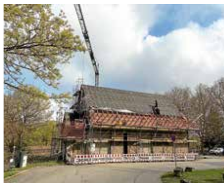
ZEAG-Scheune erhält Photovoltaikanlage

Die Fläche für Wein im Park auf dem Kiesplatz wurde von unserem Bauhof schön hergerichtet. Im Zeitraum vom 1. Mai bis 30. September können dort Bewirtungen und Veranstaltungen stattfinden. Es wäre eine Bereicherung, wenn Vereine/Private und Institution die Bewirtung bei Wein im Park übernehmen und so die Tage belegen. Bislang sind 8 Reservierungen eingegangen. Über weitere Meldungen würden wir uns sehr freuen. Nehmen Sie gerne Kontakt mit den Lauffener Weingärtner eG, Tel. 07133/18543 auf.