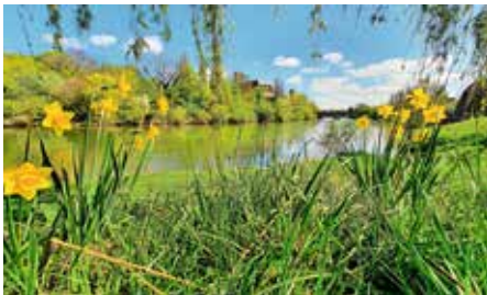
Frühling am Neckarufer in Lauffen a.N.: im Vordergrund Narzissen, im Hintergrund Neckar und Rathausburg

Für Samstag, 11. April 2026 heißt es: Keine Langeweile, Ereignis pur: Führung Neues und Altes vom Neckar.