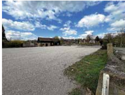
Ab Mai werden wieder der beliebte Bus und Weinaus-schankwagen bei Wein im Park stehen.

Stadtputzete durchgeführt. Hierfür herzlichen Dank! Müll ist derzeit leider ein großes Thema. Wir brauchen daher weitere Stadtputzaktionen. Dabei kann auch jeder ganz persönlich mithelfen. Beispielsweise beim Sonntagsspaziergang eine Tüte und Handschuhe mitnehmen – so tragen wir auch als Bürger dazu bei, dass unsere Stadt wieder sauberer wird.