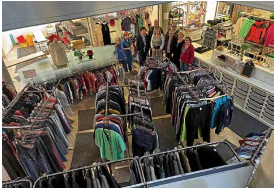
In angenehmer Atmosphäre nachhaltig einkaufen und Gutes tun – das Montagslädle

Das Montagslädle hat sich längst zu einem festen Bestandteil des sozialen Lebens in Lauffen entwickelt. Menschen unterschiedlichster Herkunft und Altersgruppen kommen hier zusammen – sei es zum Einkaufen, Stöbern oder einfach für ein Gespräch. Die freundliche und offene Atmosphäre lädt dazu