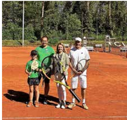
Saisonöffnung beim TCL