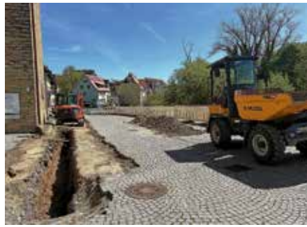
Baggerarbeiten im Rathaushof auf der Insel