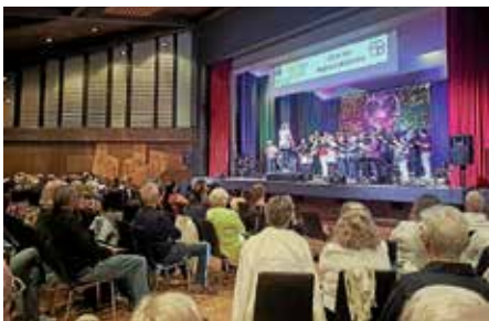
Rund 350 Teilnehmer bei „Lauffen singt“

gut besucht war wieder der Kunsthandwerkermarkt Tausendschön im Klosterhof: kein Parkplatz mehr frei und die Besucher schoben sich durch die Gänge der liebevoll dekorierten Stände. Riesige farbenfrohe Fische schwebten in den großen Bäumen. Das Ambiente im Park zieht immer mehr Gäste zum Kunsthandwerkermarkt an. Schon ab 11 Uhr herrschte reger Trubel an den Ständen. Highlight war die lange sonnige Tafel mit der kleinen Bühne für Live-Musik, an der es sich schön verweilen ließ.