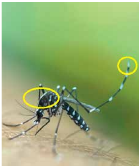
Asiatische Tigermücke

Trotz des auffälligen Aussehens kommt es manchmal zu Verwechslungen mit meist größeren und weitaus häufigeren einheimischen Stechmückenarten wie z. B. der Ringelschnake ( Culiseta annulata ).