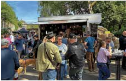
Toll besuchter Kunsthandwerkermarkt im Klosterhof bei bestem Frühlingwetter

gut besucht war wieder der Kunsthandwerkermarkt Tausendschön im Klosterhof: kein Parkplatz mehr frei und die Besucher schoben sich durch die Gänge der liebevoll dekorierten Stände. Riesige farbenfrohe Fische schwebten in den großen Bäumen. Das Ambiente im Park zieht immer mehr Gäste zum Kunsthandwerkermarkt an. Schon ab 11 Uhr herrschte reger Trubel an den Ständen. Highlight war die lange sonnige Tafel mit der kleinen Bühne für Live-Musik, an der es sich schön verweilen ließ.