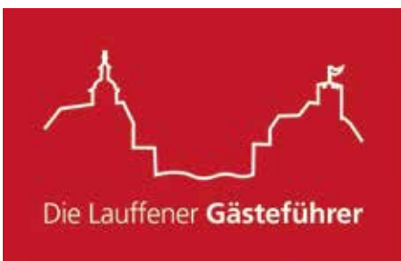
Logo Lauffener Gästeführer (Grafik: Götz Schwarzkopf)