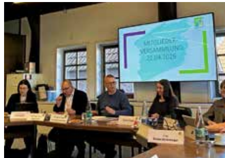
Die Mitgliederversammlung des Vereins Regionalentwicklung Neckarschleifen fand in Besigheim statt.

den kommunalen Landesverbänden empfohlenen 20 Prozent bei weitem nicht erreicht, sodass wir unser System auf den Prüfstand stellen müssen. Der Abmangel, der von allen Bürgern zu bezahlen ist, beträgt für die Krippe 1,1 Millionen Euro pro Jahr. Im Kindergarten liegt dieser gar bei 4,5 Millionen Euro. Ein Krippenplatz kostet in Lauffen im Monat 3.063 Euro. Die Eltern müssen dafür durchschnittlich künftig 431 Euro in der mittleren Einkommensstufe bei zwei Kindern zahlen. Für einen Kindergartenplatz fallen bei gleichen Voraussetzungen 175 Euro an.