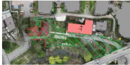
Außengelände Klosterhof mit vorgesehenen Sperrflächen (rot) und möglichen Nutzflächen (grün)

rung von Sperrflächen, Übergaberegungen) für das Außengelände des Klosterhofs (Museumsquartier) entsprechend der Anlage 5 zur „Benutzungs- und Entgeltordnung Klosterhof und Hölderlinhaus“ hat der Gemeinderat einstimmig zugestimmt. Dazu werden Gebühren entsprechend der vorgelegten Entgeltordnung Anlage 2 zur „Benutzungs- und Entgeltordnung Klosterhof und Hölderlinhaus“ erhoben.