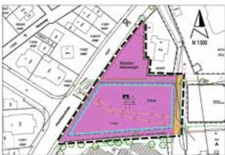
Pläne zum Bebauungsplan Weststadt Kaywaldschule

Die Stadt Lauffen am Neckar beabsichtigt, den bestehenden Bebauungsplan „Weststadt II – Teilabschnitt Friedhof“ zu ändern. Ziel dieser Planung ist es, die planungsrechtlichen Voraussetzungen für die Erweiterung der Kaywaldschule auf einer Teilfläche des bestehenden Plangebiets zu schaffen. Gleichzeitig werden durch Festsetzung, insbesondere zu Baugrenzen, Gebäudehöhe und Lärmschutz, die städtebauliche Verträglichkeit sowie der Schutz angrenzende Wohnbebauung gesichert.