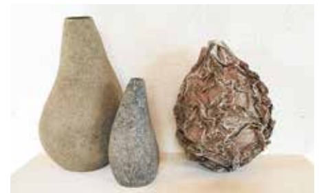
Skulptur mit Flaschen von Sibylle Nestrasil

oder als weiche Fasermasse, der sogenannten Pulpe, über ausgediente Flaschen und Gläser modelliert.