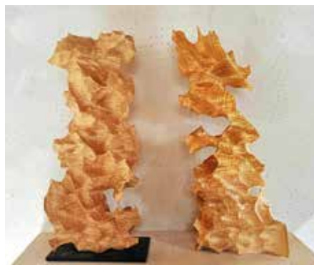
Skulptur aus Lindenholz von Stefan Hessberger

entstehen intuitiv – Durchbrüche, Höhlungen, Kanten, die in Form und Fläche spielerisch ineinander übergehen.