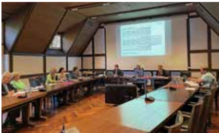
Im großen Sitzungssaal fand mit allen Trägern unserer Kindertageseinrichtungen die Bedarfsplanung statt.

die Belebung des Postplatzes und damit der Innenstadt liegt uns am Herzen. Schön war, dass wir erneut einen Französischen Markt nach Lauffen holen konnten. Sechs französische Markthändler boten kulinarische Köstlichkeiten aus dem Land der Gourmets an. Die Markthändler, die direkt aus Frankreich anreisen, hatten vielfältige Gaumenfreuden mit dabei und brachten französisches Flair auf den Postplatz.