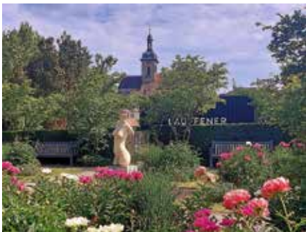
Torso Diotima im LamparterPark

Der 6. Juni 1944 („D-Day/decision-day“) markiert den Beginn der Operation Overlord, der größten amphibischen Landungsoperation der Geschichte. Alliierte Truppen aus den USA, Großbritannien