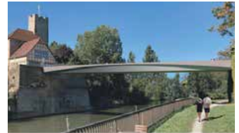
Geplanter Neubau der Rathausbrücke, schlaich bergemann partner

Spieth erläutert wird. Hinsichtlich der Kosten von rund 6 Mio. Euro teilt die Bürgermeisterin mit, dass diese nach Aussage der Projektleitung, im Vergleich mit gleichgelagerten Projekten, in der aktuellen Zeit positiv sein würden. Sie selbst hat dies anders bewertet, zumal die Baustelle im Kanal mit zahlreichen Kostenrisiken verbunden ist. Nach Sachvortrag und Wortmeldungen wird über den Beschlussvorschlag zur Vorlage 2026 Nr. 50 abgestimmt. Die Bauleistungen des Neubaus der Rathausbrücke werden an die Firma Rommel Infrastrukturbau GmbH & Co KG, Stuttgart vergeben werden.