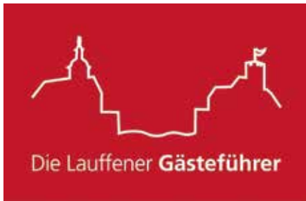
Logo Lauffener Gästeführer (Grafik: Götz Schwarzkopf)