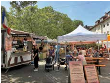
Gleich an vier Tagen besuchten uns die Marktbesucher vom Französischen Markt.

die Belebung des Postplatzes und damit der Innenstadt liegt uns am Herzen. Schön war, dass wir erneut einen Französischen Markt nach Lauffen holen konnten. Sechs französische Markthändler boten kulinarische Köstlichkeiten aus dem Land der Gourmets an. Die Markthändler, die direkt aus Frankreich anreisen, hatten vielfältige Gaumenfreuden mit dabei und brachten französisches Flair auf den Postplatz.