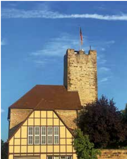
Am 23. Mai weht zum Jahrestag der Verkündung des Grundgesetzes die Deutschlandfahne auf dem Burgturm