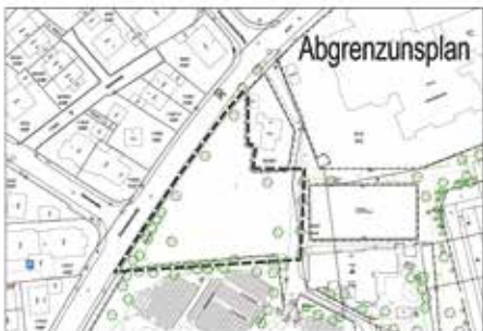
Pläne zum Bebauungsplan Weststadt Kaywaldschule

Der Geltungsbereich der Änderung ist im Lageplan des Stadtbauamts Lauffen am Neckar vom 10.04.2026 umgrenzt und umfasst einen Teilbereich des Flurstückes Nr. 11799 – siehe Übersichtsplan.