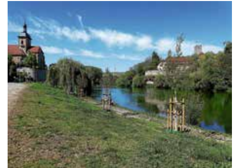
Mittlerweile entwickeln sich die Schwarzpappeln am Neckar gut

ZEAG die Energiezukunft aktiv mit – für Kommunen, Unternehmen und Menschen vor Ort.