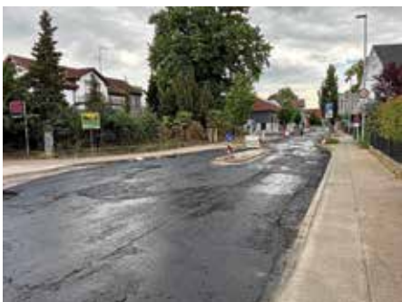
Die Baustelle in der Stuttgarter Straße

Sonne, kaum Wolken: Über Pfingsten und in der ersten Ferienwoche zeigte sich der Frühsommer von seiner besten Seite. Das nutzten in Lauffen zahlreiche Erholungssuchende, um nach dem Bibber-Wetter der vorangegangenen Wochen die warmen Strahlen auf der Haut zu genießen und sich zwischendurch abzukühlen. Dazu bietet unser Freibad „Ulrichsheide“ beste Voraussetzungen. Wir freuen uns sehr über die Bewertung im baden-württembergischen Ranking mit Platz 53. Damit einer der besten Plätze in der Region Heilbronn. Mit Schwimmerbecken, Sprungtürmen, großer Rutsche, Aufenthaltsbecken mit Strudel und Wasserliegen, toller Bewirtung am Kiosk, Tischtennisplatten, Beach-Volleyball, Spielplatz und Kinderbecken, vielen Parkplätzen sowie einer traumhaften Lage direkt am Neckar zieht das Freibad „Ulrichsheide“ Besucher aus der ganzen Region. Über eine Verstärkung mit Rettungsschwimmer oder Schwimmmeister würden wir uns sehr freuen. Bei Interesse gerne im Rathaus melden, Tel. 07133/106-51.