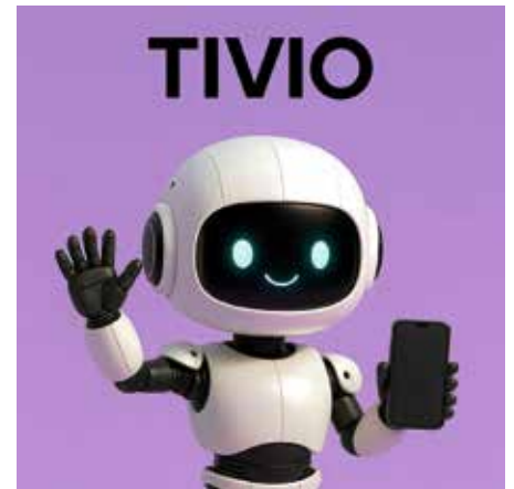
Tivio – der neue digitale Kollege in der Stadtverwaltung

Conrad Fink vom Arbeitskreis zur Erhaltung der Neckar-Schwarzpappel besuchte jüngst Lauffen und ließ uns ausrichten: „Ich habe mit Freude festgestellt, dass unsere neu gepflanzten Schwarzpappeln sehr schön ausgetrieben haben. Sie stehen sehr gut da und wachsen gut an. Das ist auch der guten Vorbereitung und der vorbildlichen Pflanzung (Gießrand, Doppeldreibock, Verbißschutz) zu verdanken. Ein Lob an Ihren Bauhof und die Stadtgärtnerei.“