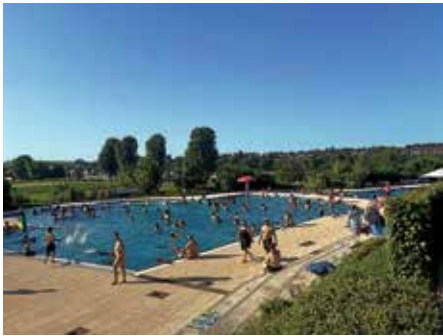
Traumhaftes Wetter an Pfingsten lockte viele in unser schönes Freibad „Ulrichsheide“

Sonne, kaum Wolken: Über Pfingsten und in der ersten Ferienwoche zeigte sich der Frühsommer von seiner besten Seite. Das nutzten in Lauffen zahlreiche Erholungssuchende, um nach dem Bibber-Wetter der vorangegangenen Wochen die warmen Strahlen auf der Haut zu genießen und sich zwischendurch abzukühlen. Dazu bietet unser Freibad „Ulrichsheide“ beste Voraussetzungen. Wir freuen uns sehr über die Bewertung im baden-württembergischen Ranking mit Platz 53. Damit einer der besten Plätze in der Region Heilbronn. Mit Schwimmerbecken, Sprungtürmen, großer Rutsche, Aufenthaltsbecken mit Strudel und Wasserliegen, toller Bewirtung am Kiosk, Tischtennisplatten, Beach-Volleyball, Spielplatz und Kinderbecken, vielen Parkplätzen sowie einer traumhaften Lage direkt am Neckar zieht das Freibad „Ulrichsheide“ Besucher aus der ganzen Region. Über eine Verstärkung mit Rettungsschwimmer oder Schwimmmeister würden wir uns sehr freuen. Bei Interesse gerne im Rathaus melden, Tel. 07133/106-51.