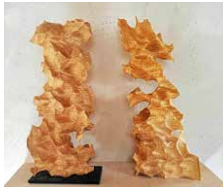
Skulptur aus Lindenholz von Stefan Hessberger

Kanten, die in Form und Fläche spielerisch ineinander übergehen.