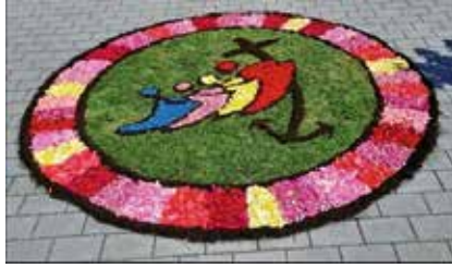
Kunstvoll ausgelegter Blument Teppich in Lauffen a.N. im letzten Jahr