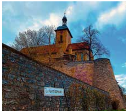
Die Regiswindiskirche Foto: Uwe Milbradt – aus dem Wettbewerb zum Foto des Jahres 2025

Schon jetzt zeigt sich, wie bunt und vielseitig das Jubiläumsjahr werden wird. Geplant sind besondere Gottesdienste, Konzerte un-