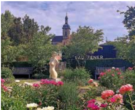
Torso Diotima im LamparterPark

Der 6. Juni 1944 („D-Day/Decision-Day“) markiert den Beginn der Operation Overlord, der größten amphibischen Landungsoperation der Geschichte. Alliierte Truppen aus den USA, Großbritannien und Kanada landeten an der Küste der Normandie in Frankreich. Und heute, am Samstag, 6. Juni 2026 findet ab 15 Uhr eine Führung durch Dorf und Dörfle statt. Treffpunkt ist der kostenlose Parkplatz Hagdol. Dann stehen Kreisel mit frisch geputzten Figuren Herzog, Goethe, Schiller, Hölderlin, sandalenbekleidete Diotima etc. auf dem Programm. Weiter: Klosterhof, Hölderlinhaus-Hof, LamparterPark für drei Generationen mit dem Torso Diotima als Antidemenzfigur, Zabermündung, ein Ausgangspunkt für hef-