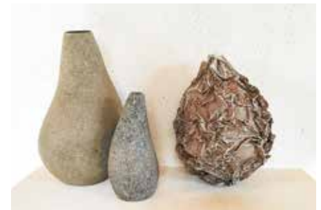
Skulptur mit Flaschen von Sibylle Nestrasil

Pulpe, über ausgediente Flaschen und Gläser modelliert.