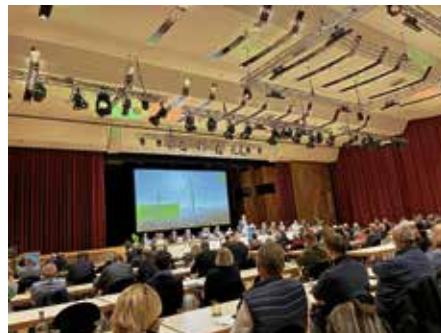
Bei der Hauptversammlung der ZEAG Energie AG ging es um die Zukunft der Energieversorgung

hat zum Glück auch ordentlich funktioniert. Mittlerweile ist die Baustelle in einer heißen Witterungsphase gestartet. Von rund 40 Grad auf der Baustelle berichten die acht Bauarbeiter. Nun geht es weiter mit dem zweiten Bauabschnitt, beginnend ab der Wilhelmstraße über die Uferstraße bis zur Einmündung Eisenbahnstraße. Auch wenn die Baustelle eine belastende Zeit wird, sind wir froh darüber, dass das Land Baden-Württemberg entsprechende Mittel bereitgestellt hat, um nunmehr den doch recht schadhafte Fahrbahnbelag auf der L 1103 und im Kreisverkehr zu erneuern. Um die Einschränkungen für den Gesamtverkehr während der Maßnahme recht gering zu halten, hat man die Ausführung in drei Teilabschnitte aufgeteilt. Was den Kreisverkehr anbelangt, wurde hier extra ein verlängertes Wochenende ausgewählt, damit nicht der tägliche Berufsverkehr zwischen Zabergäu und Heilbronn in Leidenschaft gezogen wird. Wir hoffen auf eine unfallfreie Baustelle und wünschen der Mannschaft alles Gute. Danke außerdem an alle Anwohner, die derzeit durch den Umgehungsverkehr und die Umleitungsstrecken eine Mehrbelastung auf sich nehmen.