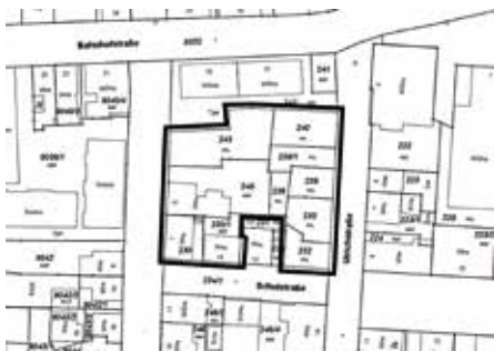
Innerstädtisches Grundstück zwischen Seugen-, Ulrich- und Schulstraße

Die Stadt Lauffen a.N. veräußert eine Fläche im Areal zwischen Seugen-, Ulrich- und Schulstraße mit einer Größe von ca. 1.374 m 2 zum Abbruch und Wiederbebauung. Das vollständige Exposé kann unter https://www.lauffen.de/website/de/wohnen_und_arbeiten/bauen_und_sanieren/staedtische-immo-