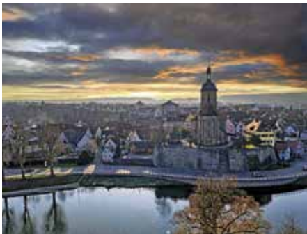
Regiswindiskirche von oben (Drohnaufnahme, Foto: Martin Braunbeck, aus dem Wettbewerb zum Foto des Jahres 2025)

Sonntagsführung am 14. Juni, 15 Uhr: Die Wahrzeichen der Stadt: Grafenburg, Neckarbrücke, Regiswindiskirche