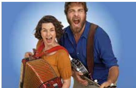
Das Welt-Folk-Duo „Tante Friedl“ ist ein echter Brüller – und sorgt unweigerlich für gute Laune.

Zu einem besonderen Sommerabend lädt das städtische Kulturprogramm „bühne frei...“ am Freitag, 26. Juni 2026, um 19 Uhr in den Lauffener Klosterhof ein: Bei der „FOLKNACHT am Klosterhof“ treffen mit der Gatehouse Irish Group und dem Duo Tante Friedl zwei herausragende Formationen der internationalen Folk-Szene aufeinander.