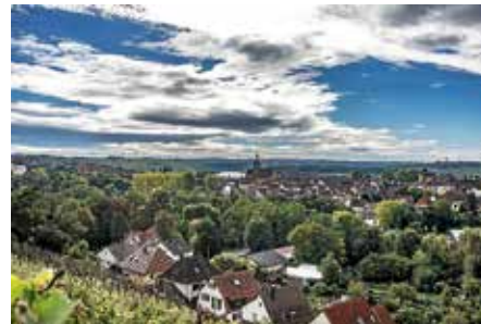
Foto: Hansjörg Sept, aus dem Wettbewerb zum Foto des Jahres 2025; Blick auf Lauffen a.N.

Sonntagsführung am 21. Juni um 15 Uhr: Stadtführung auf einen Blick