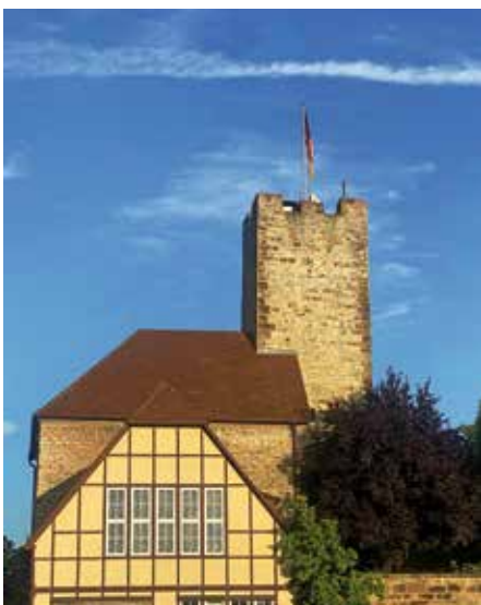
Am 23. Mai weht zum Jahrestag der Verkündung des Grundgesetzes die Deutschlandfahne auf dem Burgturm

Üblicherweise weht auf dem Burgturm die grün-weiße Stadtflagge.